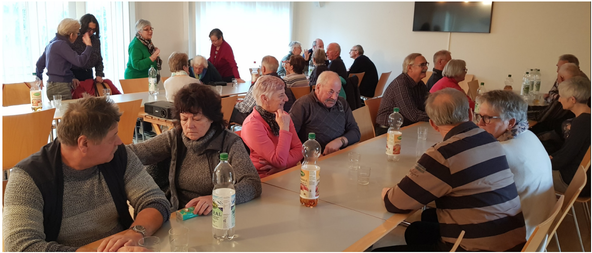
Ein Teil der zahlreichen Zuhörenden

Einmal mehr war mit dieser Veranstaltung ein erfolgreicher Start in die neue „Senetz-Saison“ geglückt, was auch im kräftigen Schlussapplaus zum Ausdruck kam.