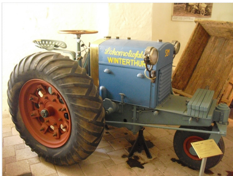
Und gleich daneben ein Dreirad-Loki- Traktor aus dem Jahre 1935